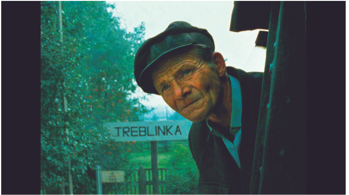
Fotograma del Documental Shoá (1985)

http://www.antoniorico.es/2018/07/imperativo-shoah.html