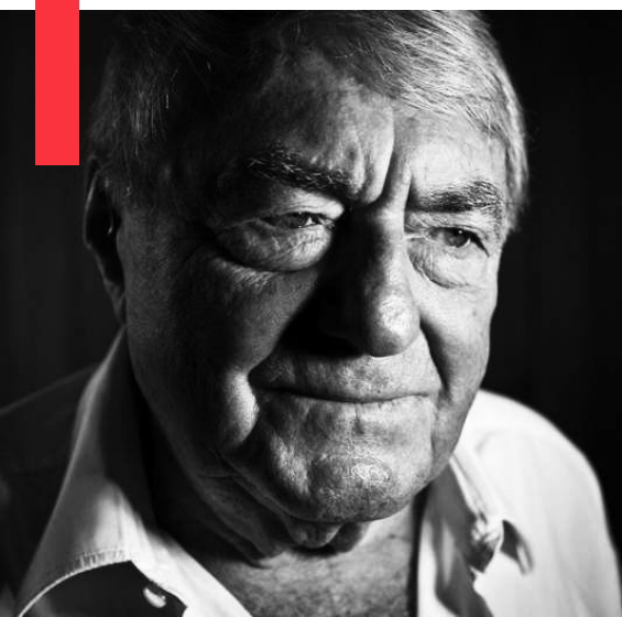
Claude Lanzmann 1925-2018

El Primer Ministro francés era Raymond Barre. Muchos años después, en 2007, Barre se refirió en retrospectiva al atentado, y así declaró en un reportaje aparecido en France Culture : "fue un atentado odioso que intentó golpear a los israelitas que iban a la sinagoga, y golpeó a los inocentes franceses que cruzaban la calle". En sus palabras, los inocentes no parecían incluir a los judíos asesinados.