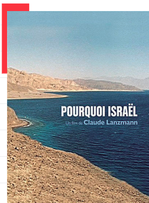
Afiche de la película Por qué Israel (1973)

El creador no se había propuesto cuestionar el porqué de la existencia del Estado judío, sino que se había plantado para dar cuenta de los motivos por los que éste es indispensable.