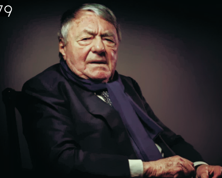
CLAUDE LANZMANN 1925 - 2018 ז"ל