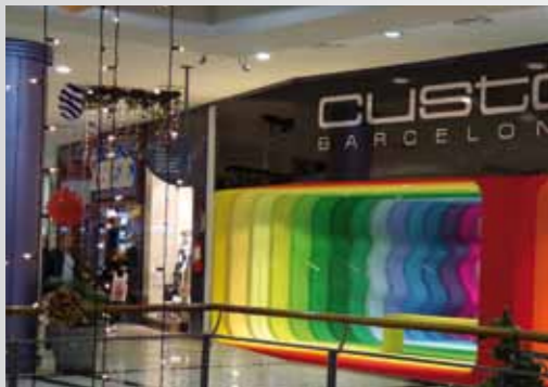
Autores: Javier Nadal, Fernanda Olivera y Paola Mordecki (Taller 4)

La carrera mantiene un convenio de cooperación y reconocimiento con la Asociación de Decoradores y Diseñadores de Interiores Profesionales (ADDIP).