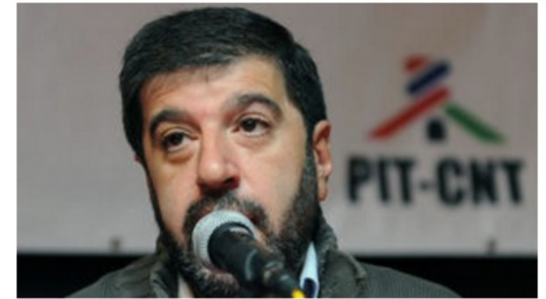
PIT-CNT decidió que no presentará recurso contra decreto “antipiquete”