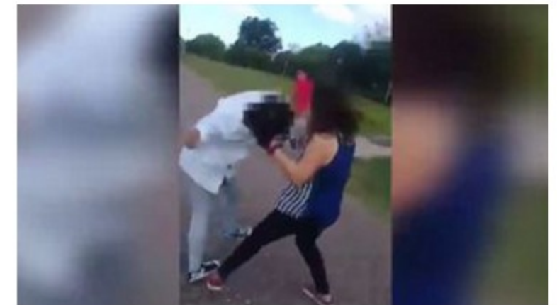
Justicia intervino en pelea entre dos adolescentes en Paysandú