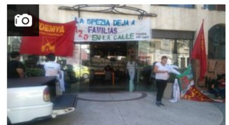
Trabajadores de La Spezia ocuparon la sede central de la empresa