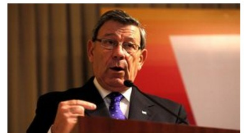
Uruguay votará en contra de aplicar Carta Democrática de la OEA a Venezuela