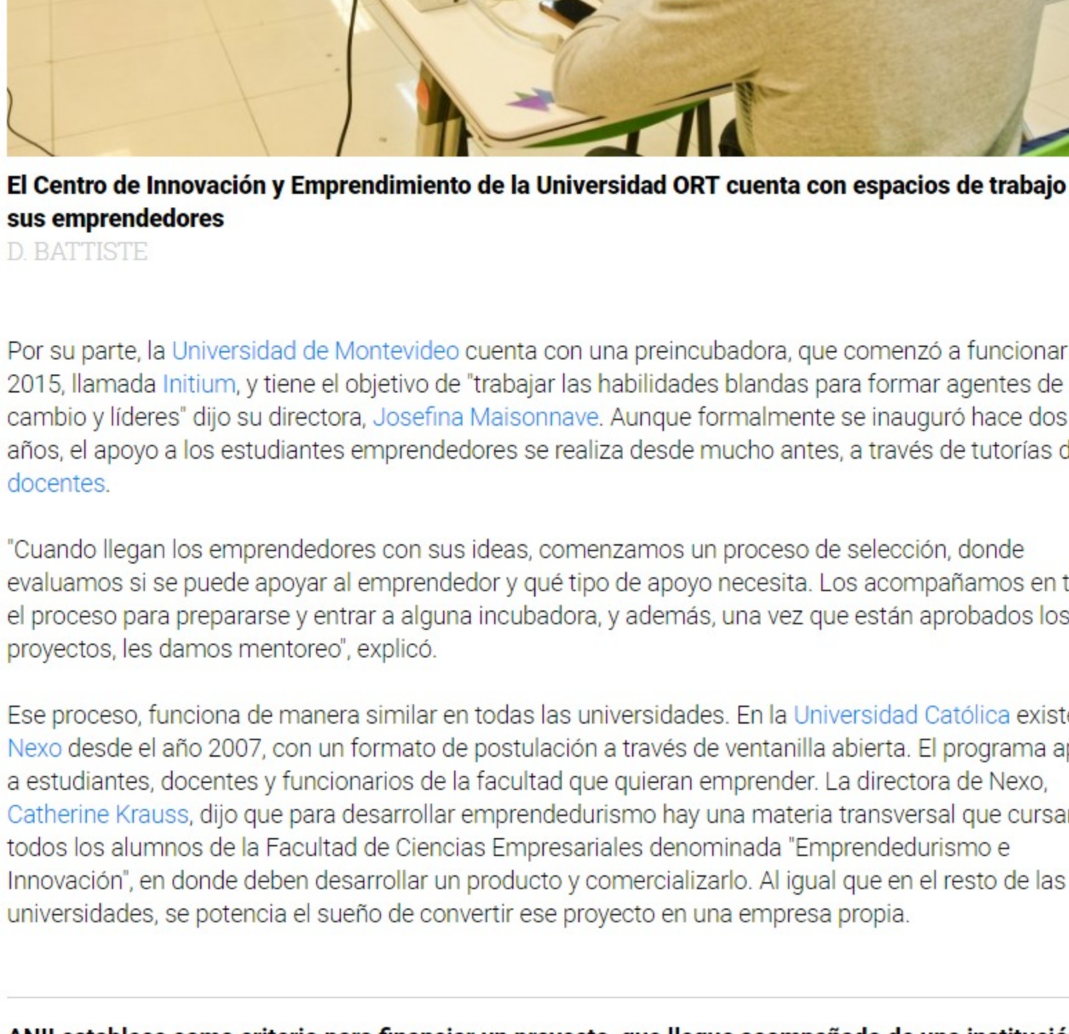
El Centro de Innovación y Emprendimiento de la Universidad ORT cuenta con espacios de trabajo para sus emprendedores