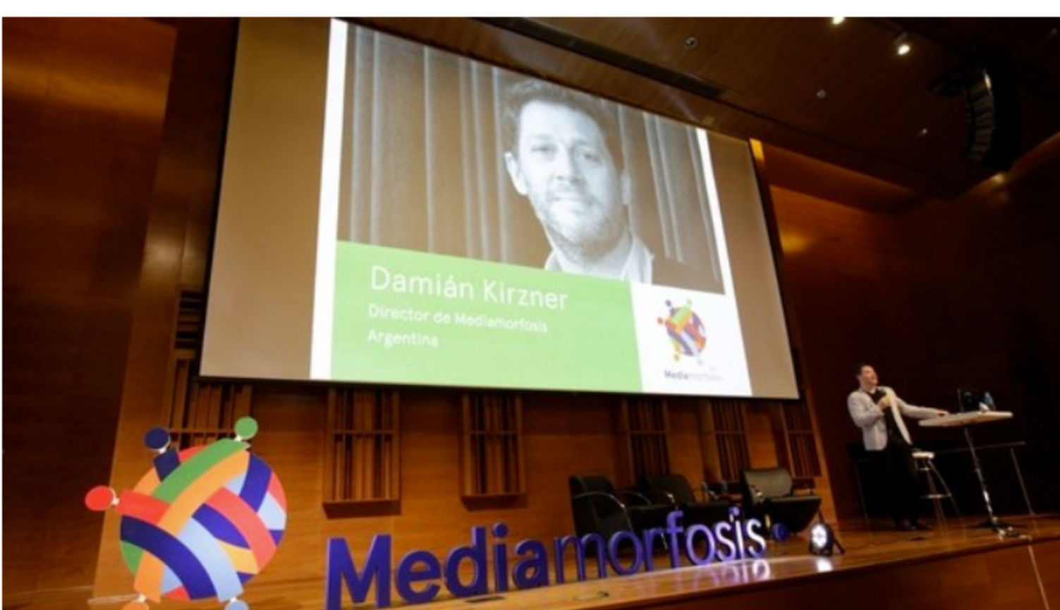
Gonzalo Frasca estará hablando sobre los desafíos que implica diseñar no sólo para niños sino para sistemas educativos que tiene muchos actores con necesidades diferentes.

“ Mediamorfosis es un evento sobre las nuevas narrativas más influyentes en Latinoamérica, que se realizará el 30 y 31 de agosto, de 9hs a 19hs en el Centro Cultural de la Ciencia – Godoy Cruz 2270 ”