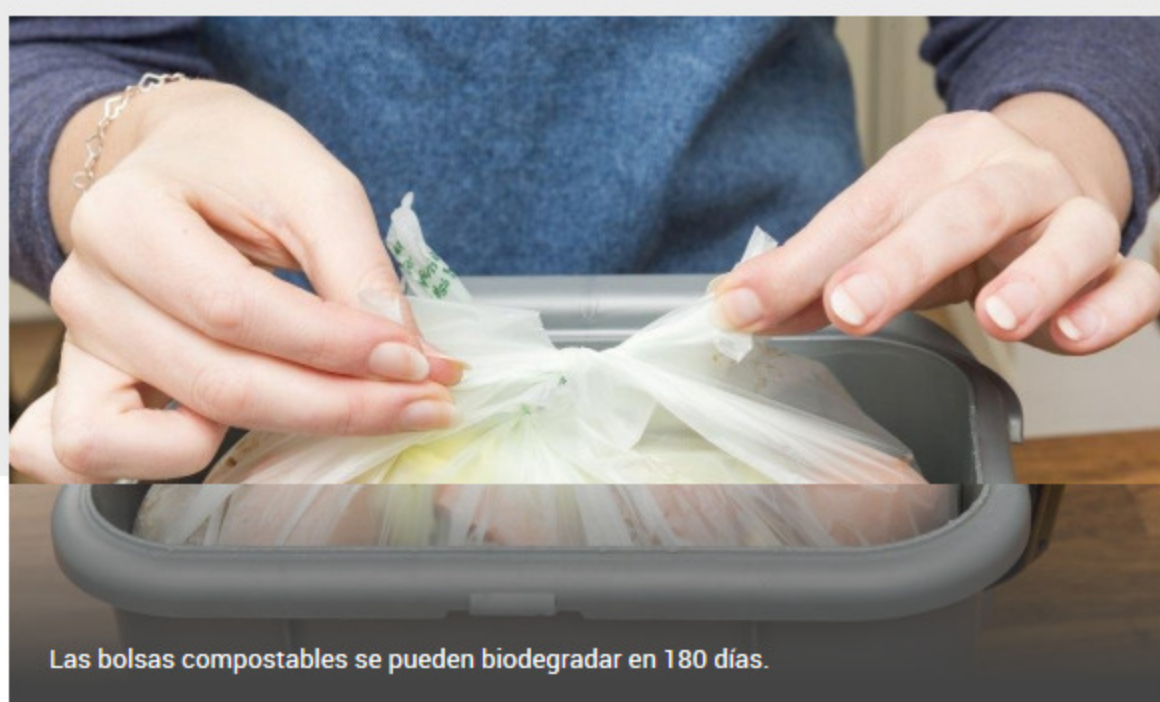
Las bolsas compostables se pueden biodegradar en 180 días.

Se calcula que en Uruguay circulan al año unas 1.200 millones de bolsas de plástico casi 400 por cada habitante del país. A nivel mundial se estima que 250.000 toneladas flotan en los océanos.