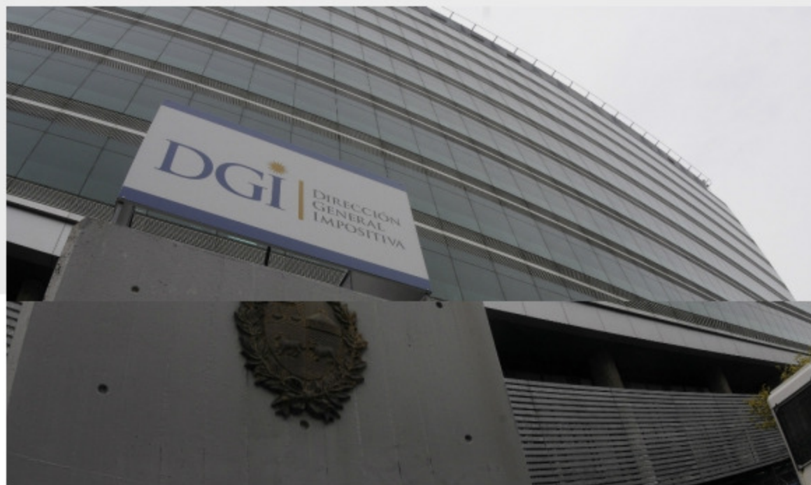
Dirección General Impositiva.

La Dirección General Impositiva (DGI) emitió una resolución la semana pasada que fija la obligatoriedad para todas las personas físicas de constituir domicilio electrónico desde junio, con la intención de sustituir las notificaciones en papel y pasar al formato electrónico.