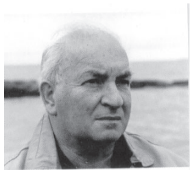
por ISAC GLIKSBERG