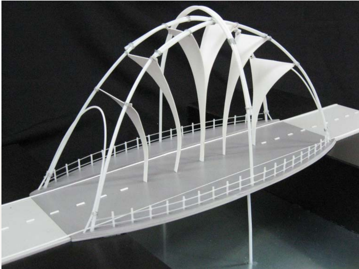
Trabajo de los alumnos de las carreras de Arquitectura y Licenciatura en Diseño de Interiores presentado en la Exposición "Maquetas de matemáticas", agosto 2007.