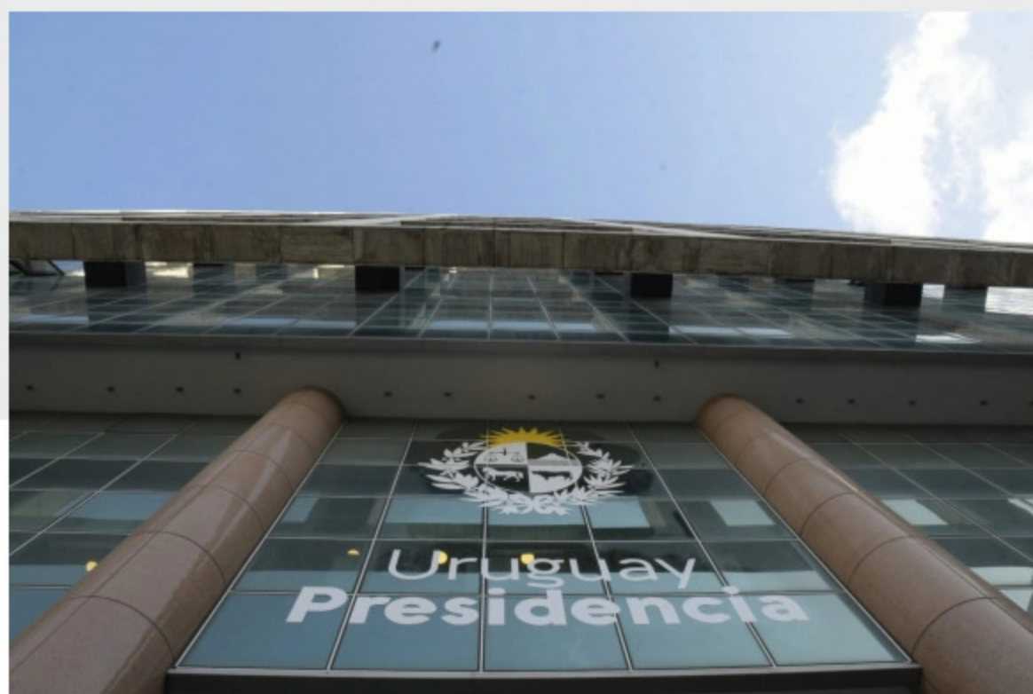
Torre Ejecutiva.

El Poder Ejecutivo envió al Parlamento un proyecto de ley que habilita “a todas las empresas constituidas en el país” a acceder al Sistema Nacional de Garantías (SiGa), que otorga avales para préstamos. Tras la llegada del coronavirus y el inicio de las medidas de aislamiento social, el gobierno amplió el fondo del SiGa de US$ 50 millones a US$ 500 millones.