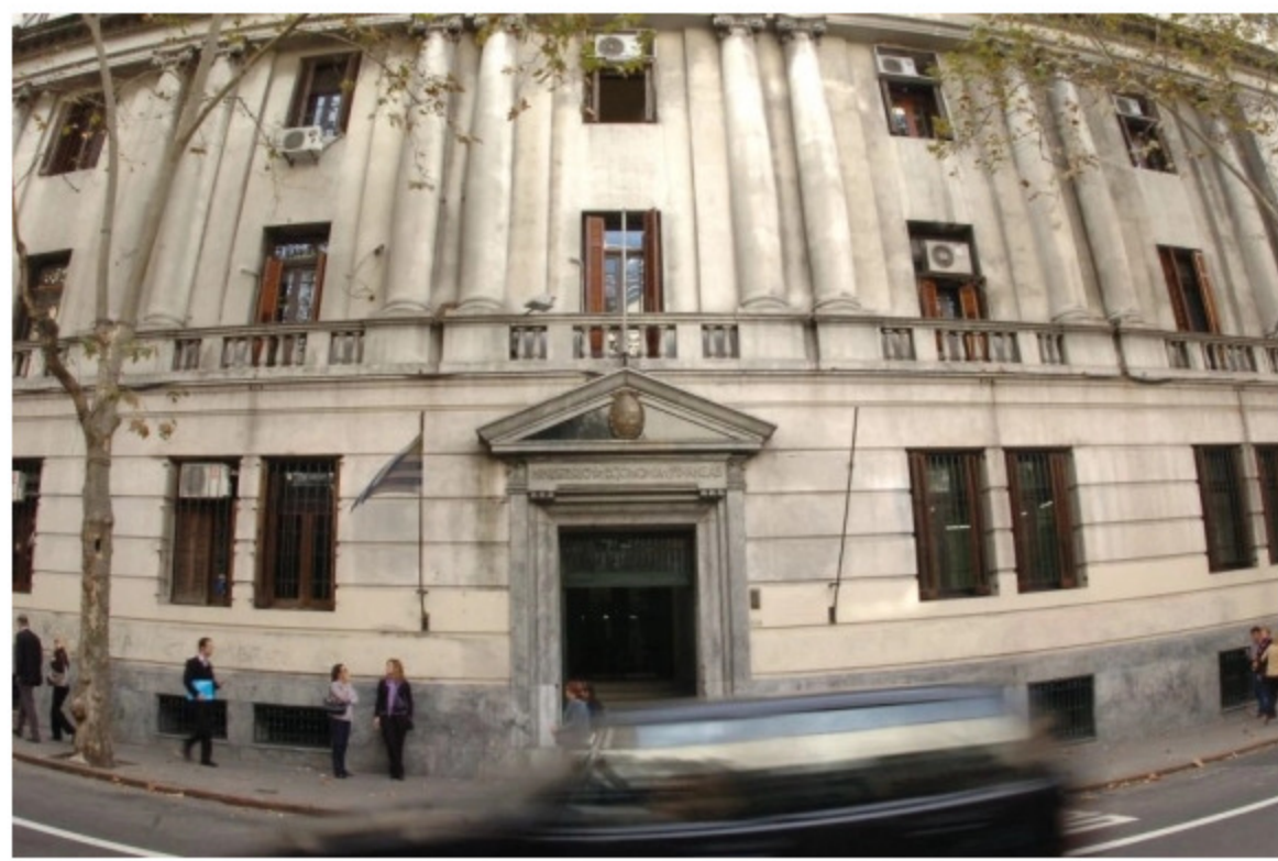
Ministerio de Economía.

Ese problema del acceso de las empresas grandes, que representan casi 70% del monto de créditos bancarios otorgados a compañías, el gobierno buscó solucionarlo con la línea SiGa Plus.