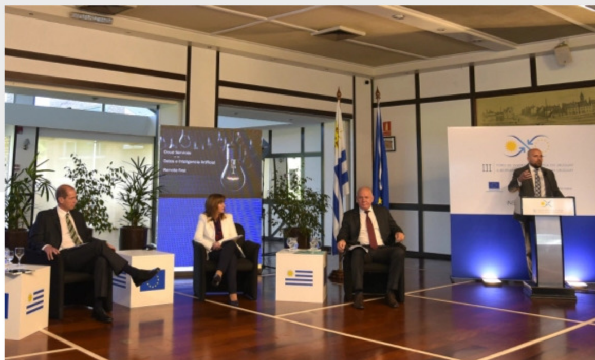
Expertos debatieron sobre digitalización y economía verde como claves para la recuperación.

La digitalización de las pequeñas y medianas empresas (pymes) uruguayas y de la administración pública, así como la implementación de políticas medioambientales que impulsen la denominada economía verde , son la clave para la recuperación económica de Uruguay tras la crisis provocada por el COVID-19 .