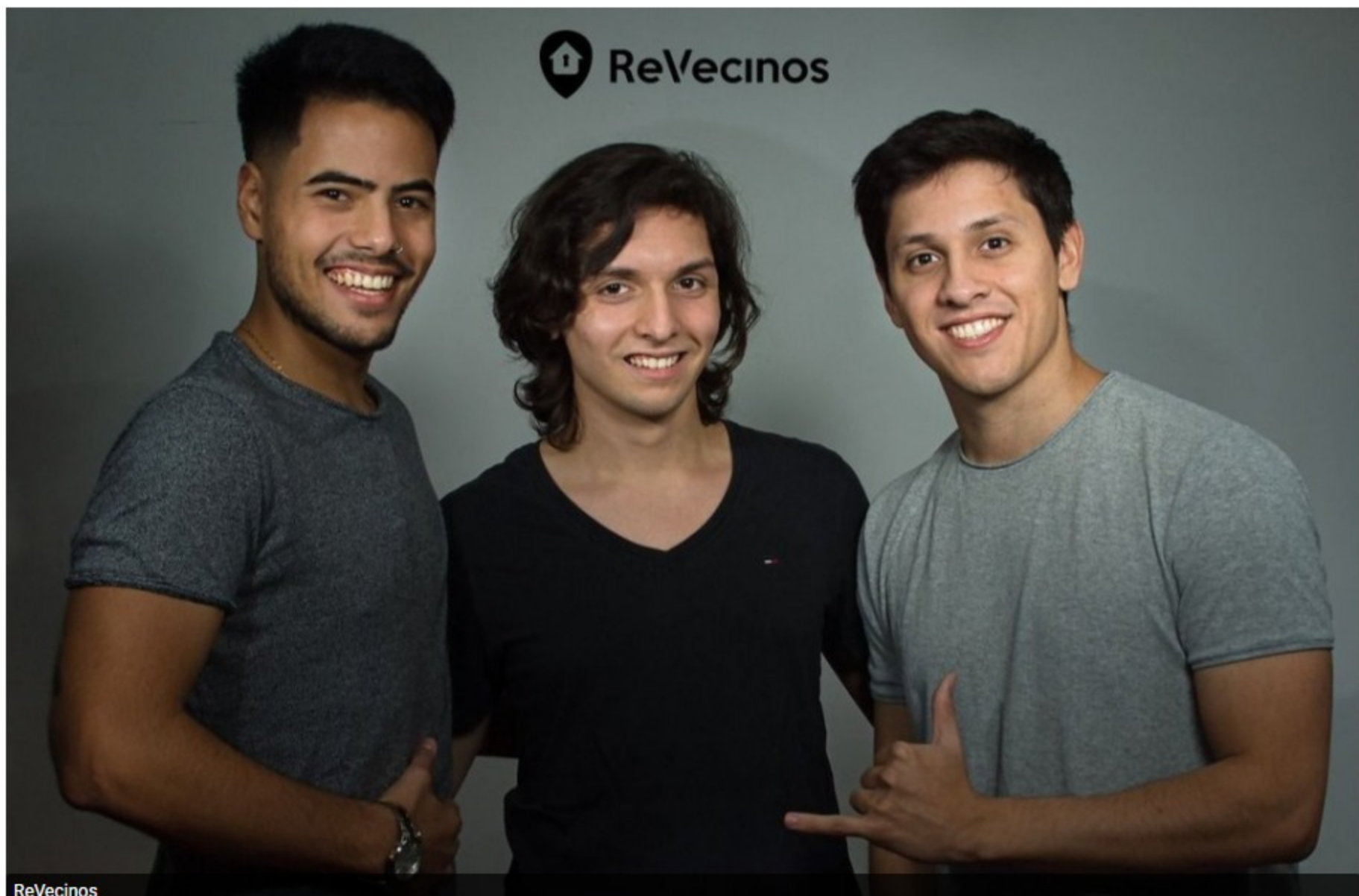
ReVecinos busca crear barrios más sólidos y seguros

Los desarrolladores aseguran que "cuando los vecinos se conectan se crean barrios más sólidos y seguros"