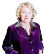
di Antonia Arslan