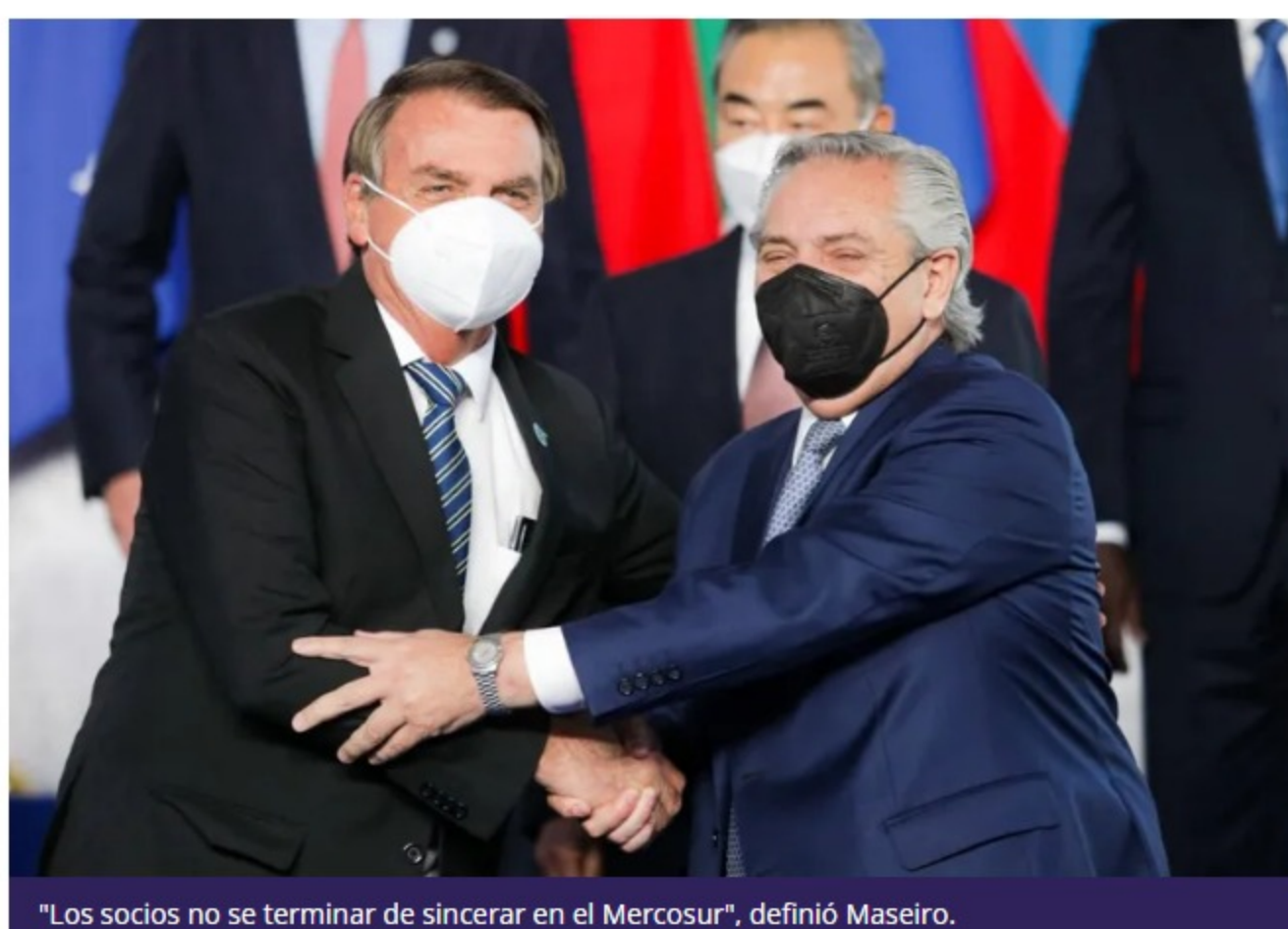
"Los socios no se terminar de sincerar en el Mercosur", definió Maseiro.

Maseiro expresó también que la Cumbre de las Américas se enmarca en el "esfuerzo que hace Biden por reinsertar a Estados Unidos en el mundo".