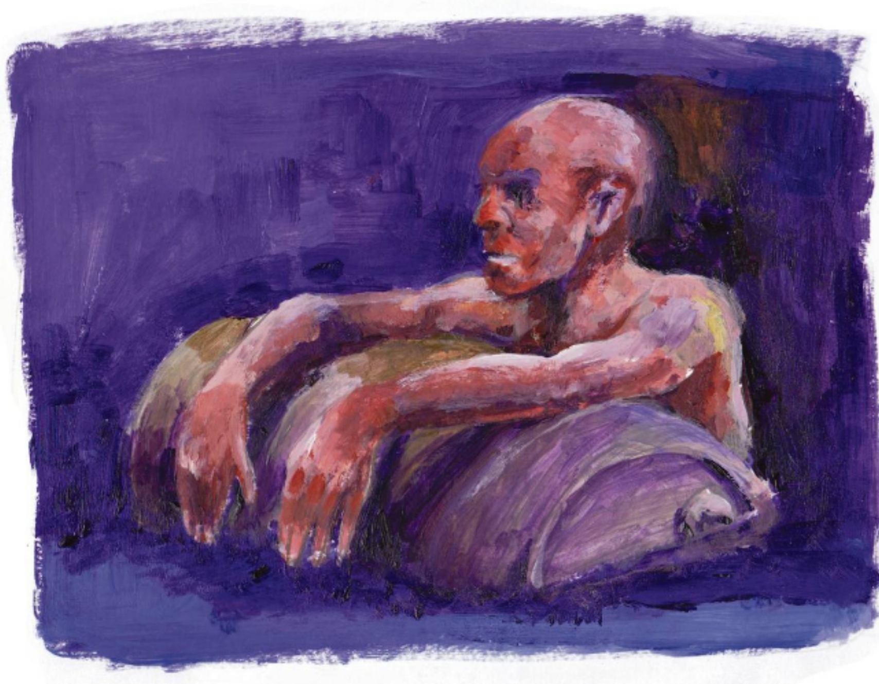
Ilustración: Ramiro Alonso