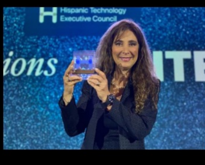
CEO de Vrio Corp fue reconocida como una de las principales líderes en tecnología de Iberoamérica