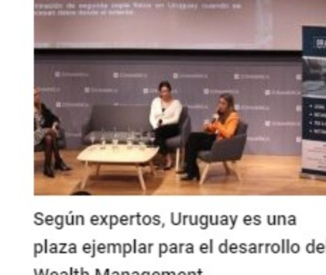
Según expertos, Uruguay es una plaza ejemplar para el desarrollo del Wealth Management