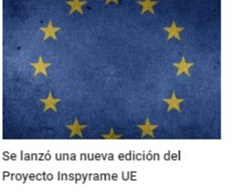
Se lanzó una nueva edición del Proyecto Inspyrame UE