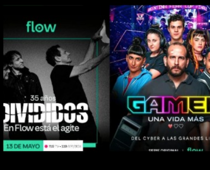
Novedades en el mundo del streaming