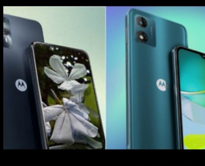
Motorola renueva los modelos moto g