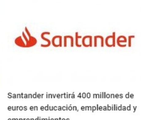
Santander invertirá 400 millones de euros en educación, empleabilidad y emprendimientos