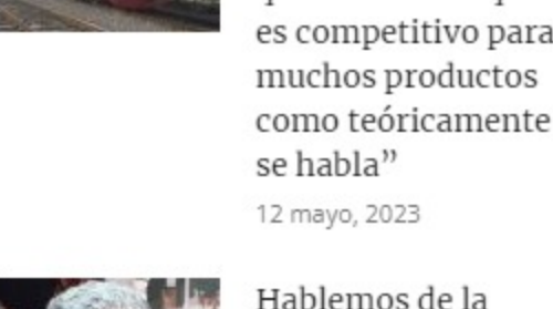
Pollak: "El ferrocarril tendrá que demostrar que es competitivo para muchos productos como teóricamente se habla" 12 mayo, 2023