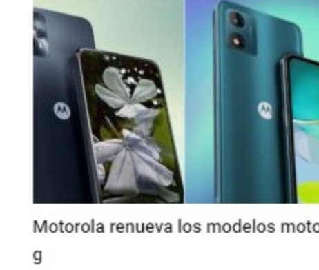
Motorola renueva los modelos moto g