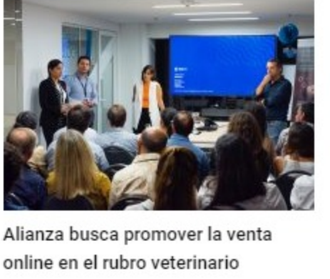
Allianza busca promover la venta online en el rubro veterinario