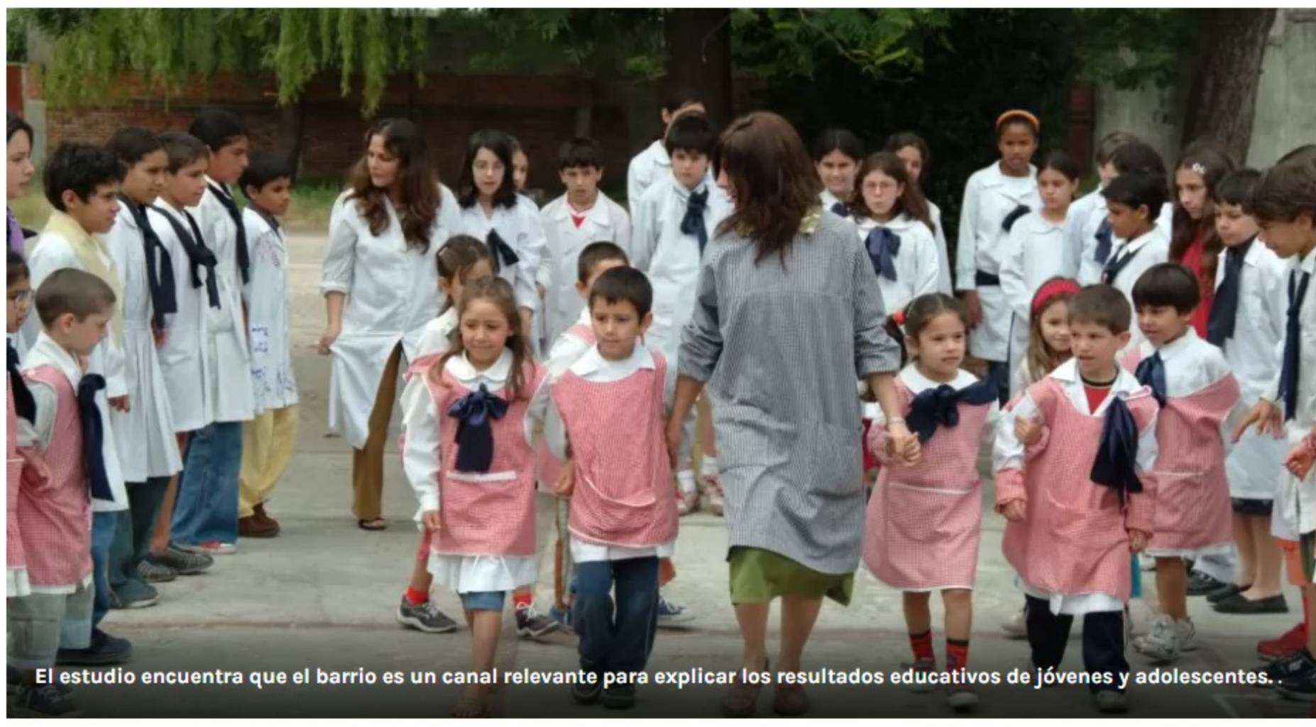
El estudio encuentra que el barrio es un canal relevante para explicar los resultados educativos de jóvenes y adolescentes...

Un nuevo informe del BID analiza el "efecto educativo del barrio"