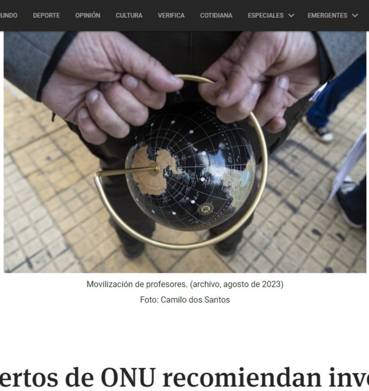
Movilización de profesores. (archivo, agosto de 2023)