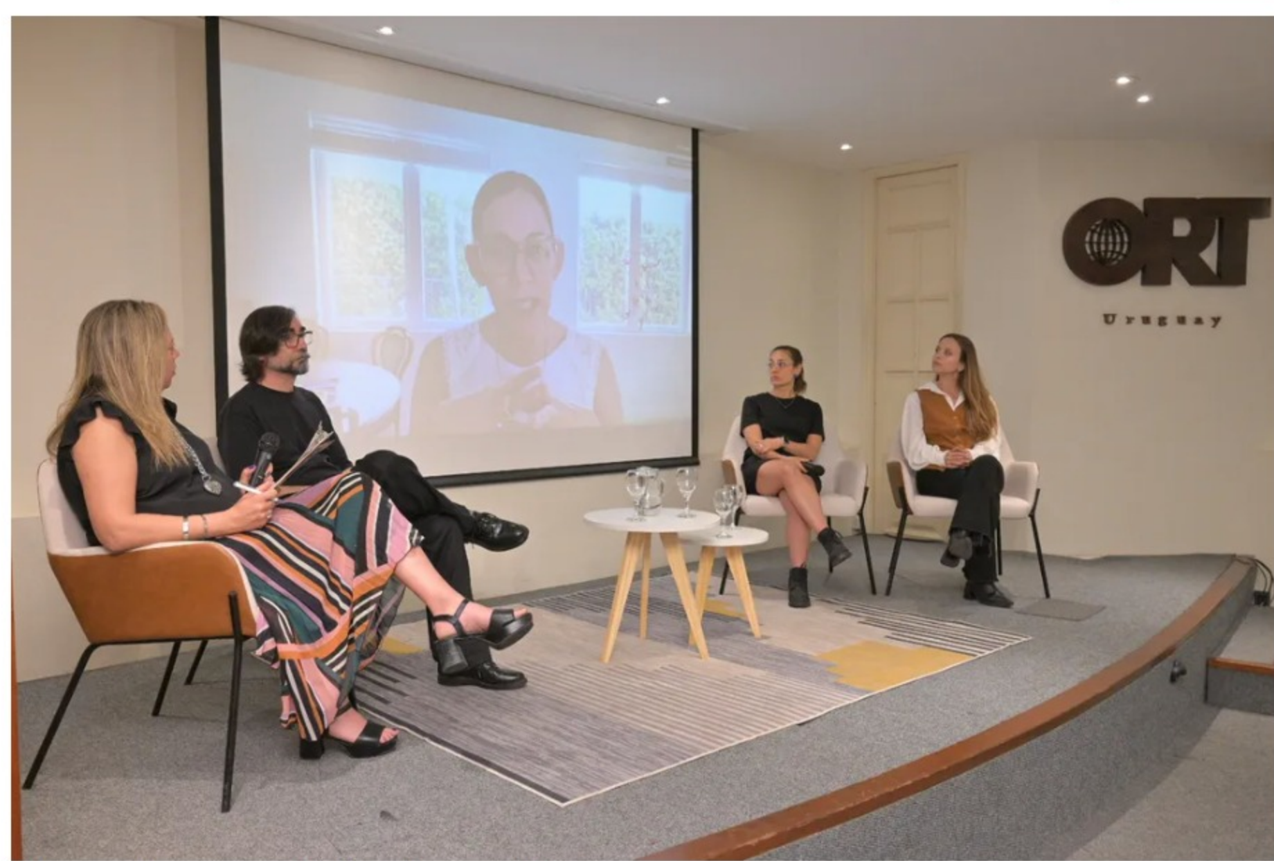
Women's Entrepreneurship Day Uruguay 2024