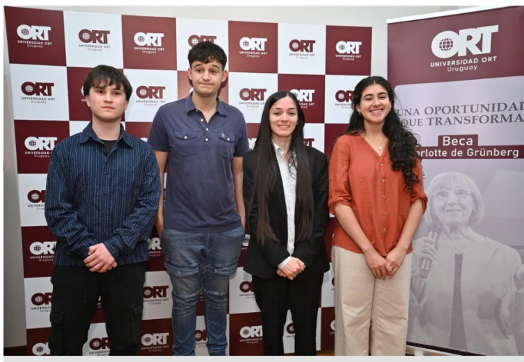
Finalistas de la Beca Charlotte de Grünberg.

La Universidad ORT realizó la premiación de la Beca Charlotte de Grünberg , una iniciativa que reconoce la excelencia académica y la motivación de estudiantes de 3.º de Educación Media Superior de todo el país, con el objetivo de acompañar su ingreso a la educación universitaria en 2026.