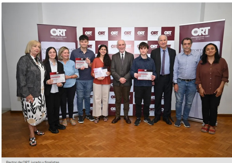
Rector de ORT, jurado y finalistas.

La ceremonia, llevada a cabo el jueves 18 de diciembre, distinguió a cuatro estudiantes finalistas seleccionados a partir de un proceso integral que combinó una prueba escrita, el análisis del desempeño académico, el contexto socioeconómico y la motivación personal para iniciar sus estudios universitarios.