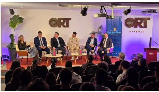
Montevideo recibirá la semana próxima la XXIV Cumbre Mundial de Comunicación Política.

Montevideo dio un nuevo paso en su proyección como plaza regional de debate político con el lanzamiento de una nueva edición de la XXIV Cumbre Mundial de Comunicación Política , presentada en la Universidad ORT Uruguay .