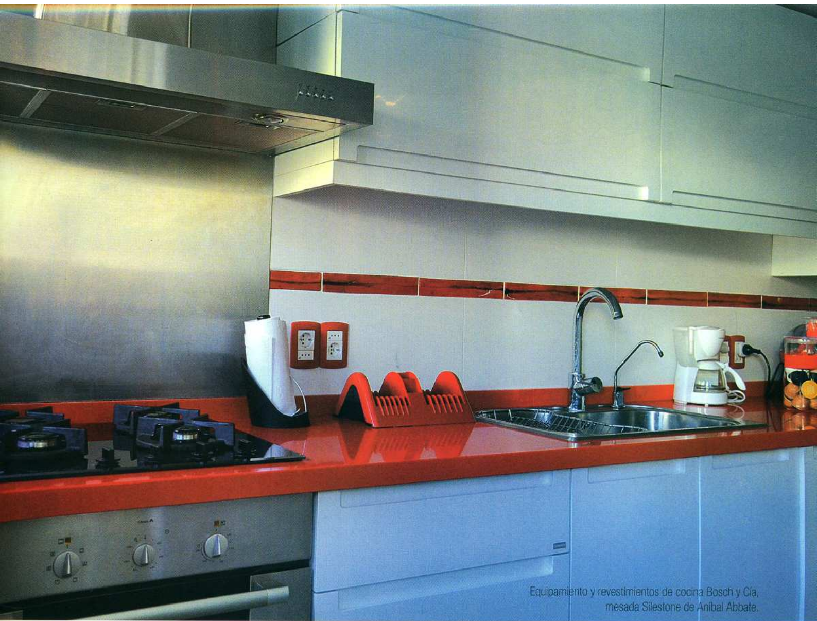
Equipamiento y revestimientos de cocina Bosch y Cia. mesada Silestone de Anibal Abbate.