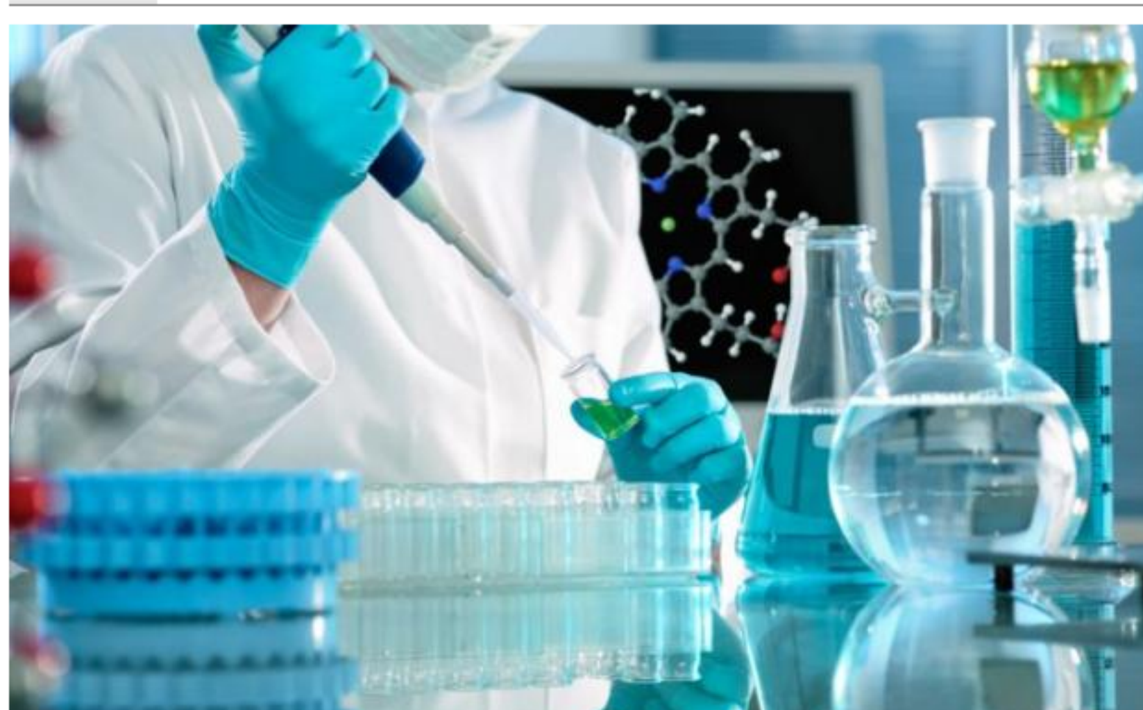
Capacidad. Empresas locales ya pueden sustituir parte de las importaciones.