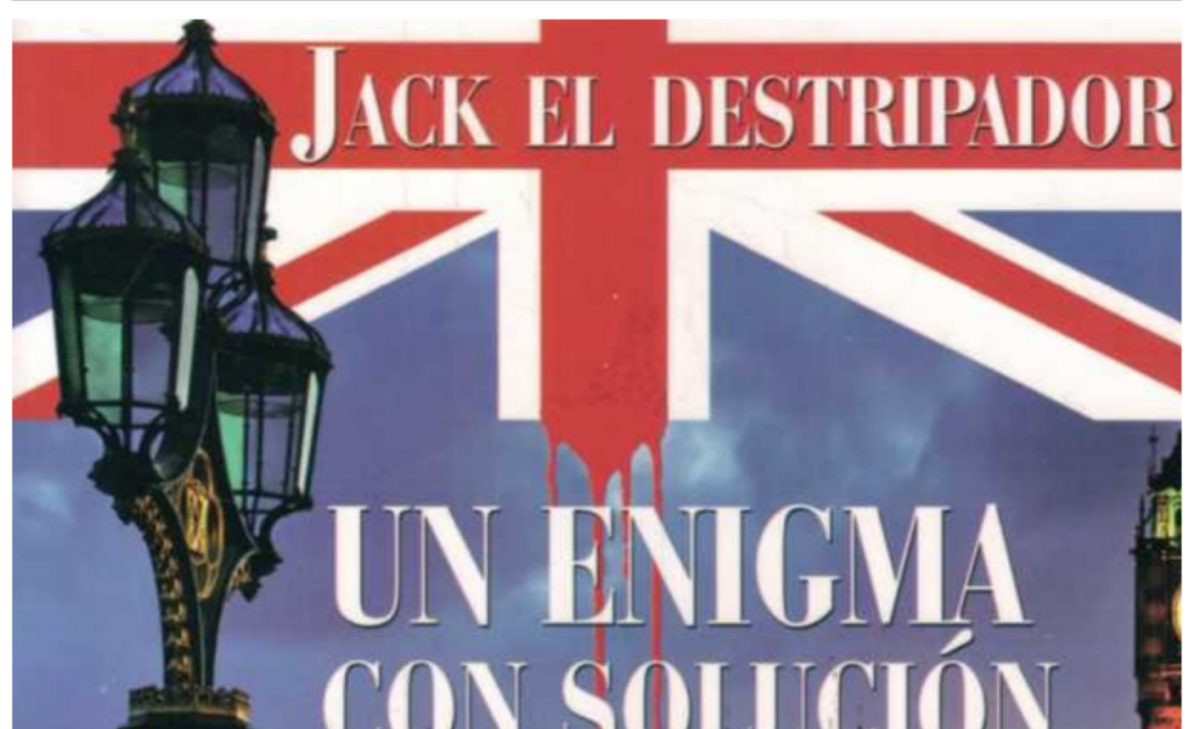
"Jack el destripador, un enigma con solución" de Eduardo Cuitiño