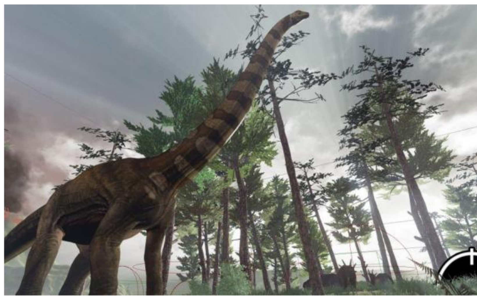
Uruguayos crean una "selva" que se puede recorrer con lentes.