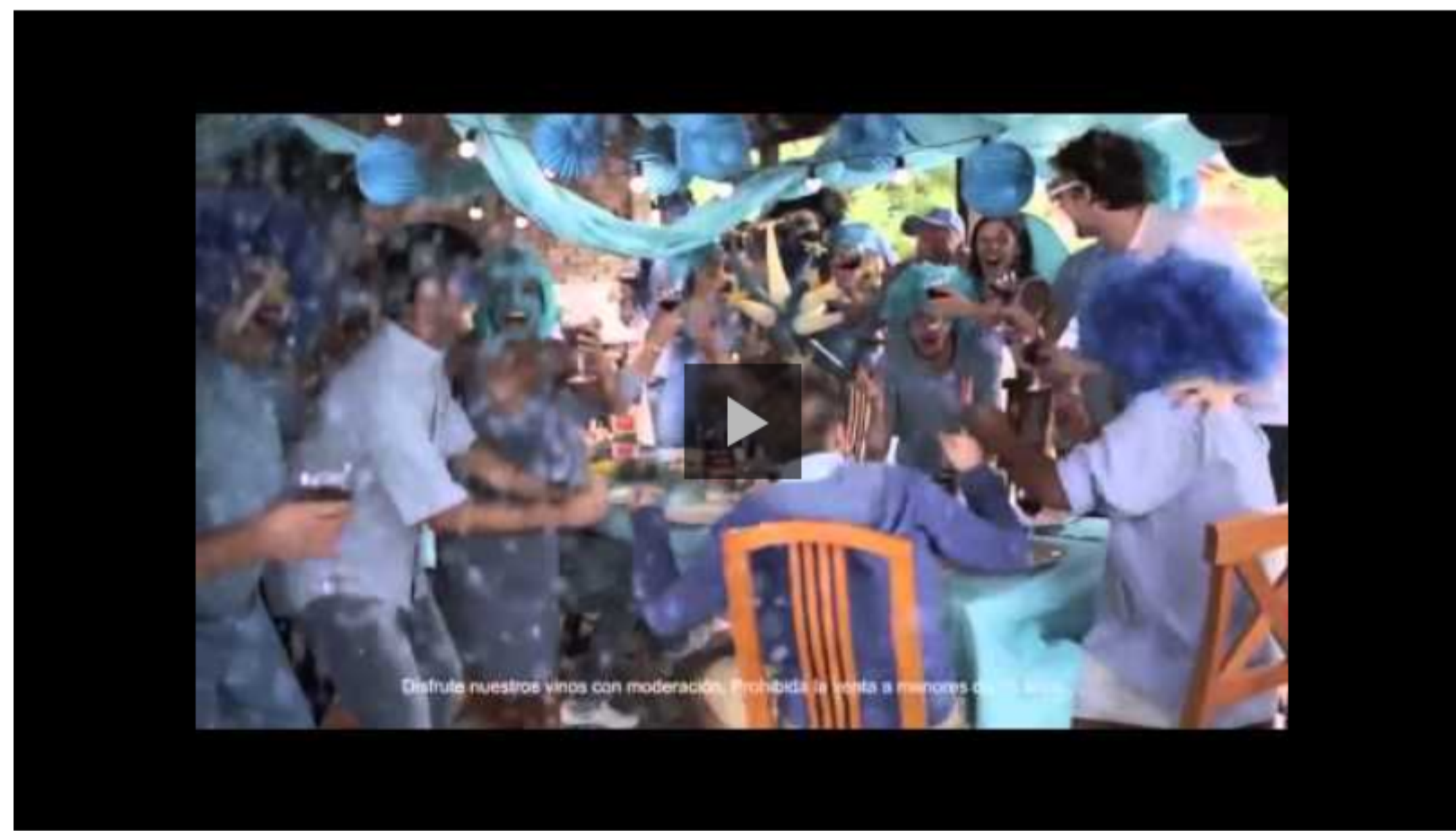
Publicidad para Santa Teresa de Young & Rubicam

Como ejemplo, el director de Young & Rubicam mostró las reacciones que generó la publicidad del vino Santa Teresa en la que se burlaba de la única Copa del Mundo que tenía Chile, de la que se habló en varios medios de la región y el mundo, además de llenar de mensajes a Twitter y Facebook. "Eso surgió de la actividad de la gente en redes sociales, fue una forma de captar creativamente lo que pasaba en las redes", puntualizó.