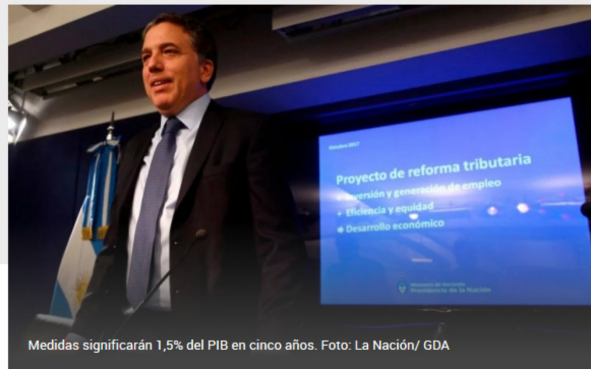
Medidas significarán 1,5% del PIB en cinco años.

El ministro de Hacienda del gobierno argentino, Nicolás Dujovne, presentó ayer una serie de cambios tributarios que habían sido anunciados de modo general el lunes por el presidente Mauricio Macri, junto a otras medidas que apuntan a tres ejes principales: promoción del empleo, calidad institucional y responsabilidad fiscal.