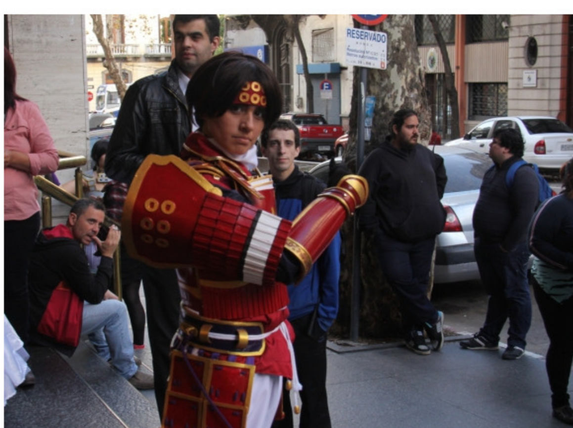
Edición 16 de Montevideo Comics en el Auditorio del Sodre, en la calle Andes y Mercedes.

El evento va por las 17 ediciones y no han parado de sumar público: el año pasado fueron más de 8.000 personas, se espera más o menos la misma cantidad para esta edición. Como desde hace tres años, la convención se realiza en los dos auditorios del Sodre y en el Centro Cultural de España.