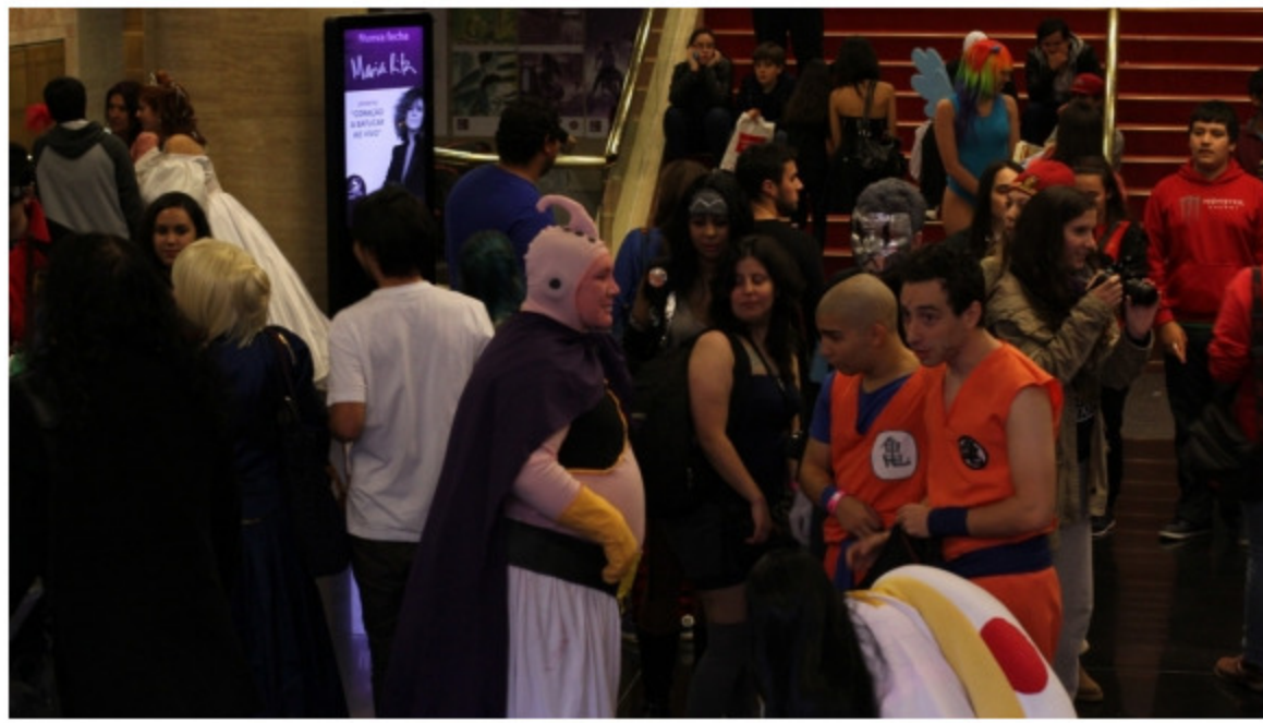
Imágenes de la edición del año pasado, donde miles de fanáticos del comic coparon las instalaciones del Auditorio Adela Reta del Sodre.

A las novedades se suman los Youtubers que llegan y tienen una temática similar a la de la convención. El mexicano Mr. X que suele comentar sobre comics y películas de superhéroes viene a Montevideo, al igual que la colombiana Paulette que tiene un canal donde se cuentan historias de terror.