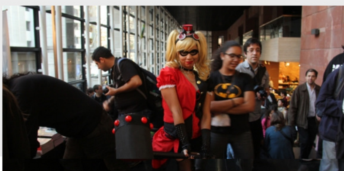
Montevideo Comics, una fiesta para ver, conocer y divertirse en el mundo del comic.

Montevideo Comics se ha vuelto un clásico de la ciudad. Y esa fiesta que reúne amantes del cómic, el animé, las películas y los juegos, volverá ocupar todas las instalaciones del enorme Auditorio Adela Reta del Sodre. Nada mal para una idea que empezó en un sótano para un centenar de enterados.