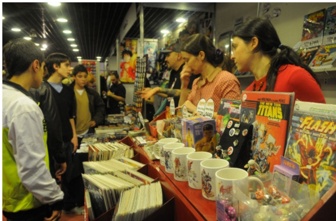
Además de charlas y películas habrá stands de diferentes editoriales.

Como siempre las entradas se adquieren en boletería de la sala y a través de Tickantel que tienen distintos precios. El pase para un solo día cuesta 420 pesos, mientras el abono para el fin de semana vale 630 pesos. Para los que se animan a ir disfrazados (o sea hacer cosplay), la entrada queda a 290 pesos, y niños de hasta nueve años entran gratis. La entrada a la convención incluye un regalo. Este año se entregarán 1.500 copias por día de un libro creado en exclusiva para el evento que recopila la obra de el uruguayo Tabaré, el creador de "Diógenes y el linyera", y recordado por su pasaje en la década de 1980 por la revista Humo(r) Registrado.