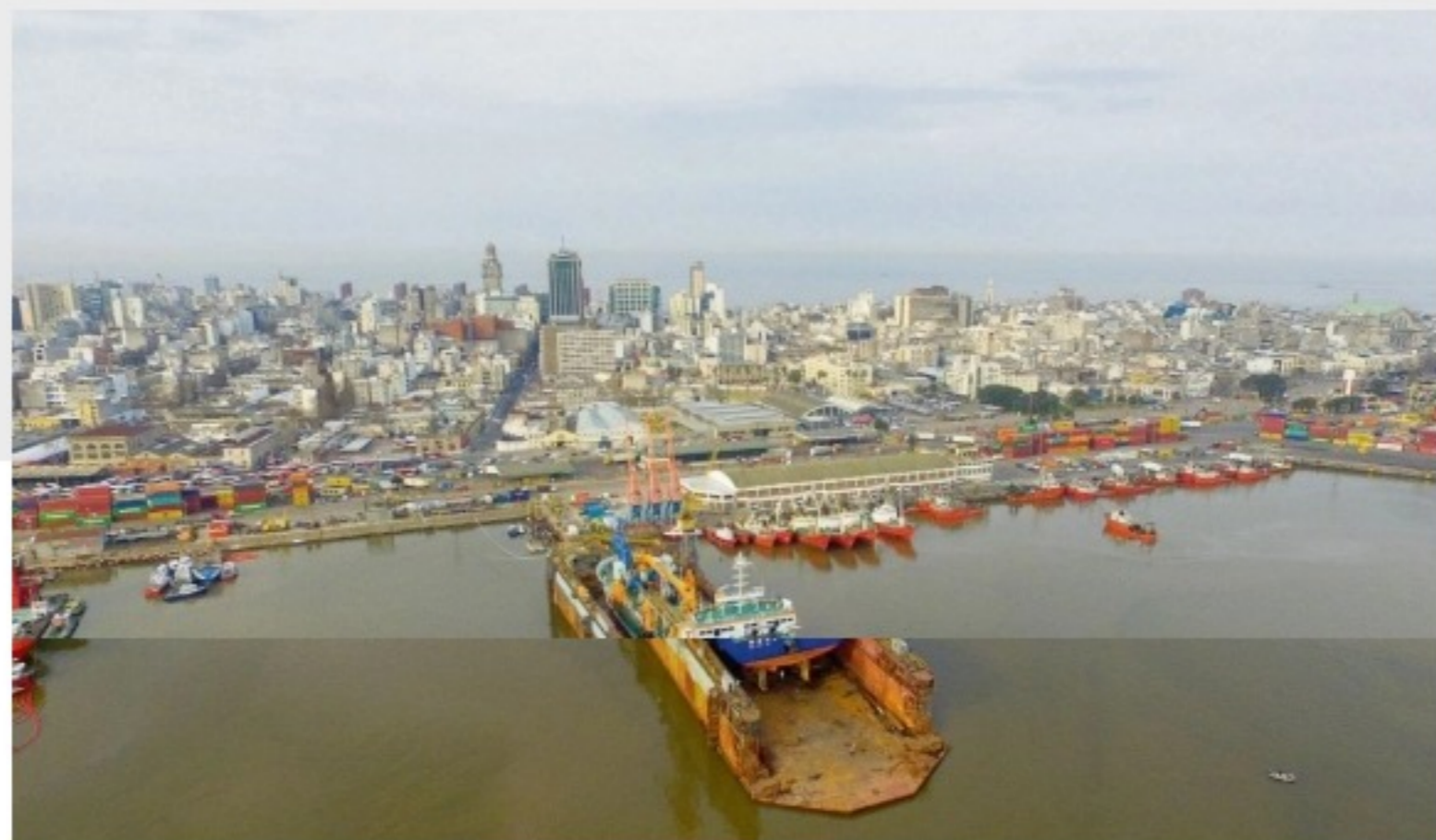
Puerto de Montevideo.

Si esto fuera un torneo mundial de economías prósperas hacia la cuarta revolución, Uruguay quedó en la mitad de tabla -lugar 54 entre 141 países- e integra el podio de América Latina -detrás de Chile y México-. Tiene su mejor desempeño en la adopción de tecnologías de la información y comunicación (TIC) y su peor performance refiere a la capacidad de innovar.