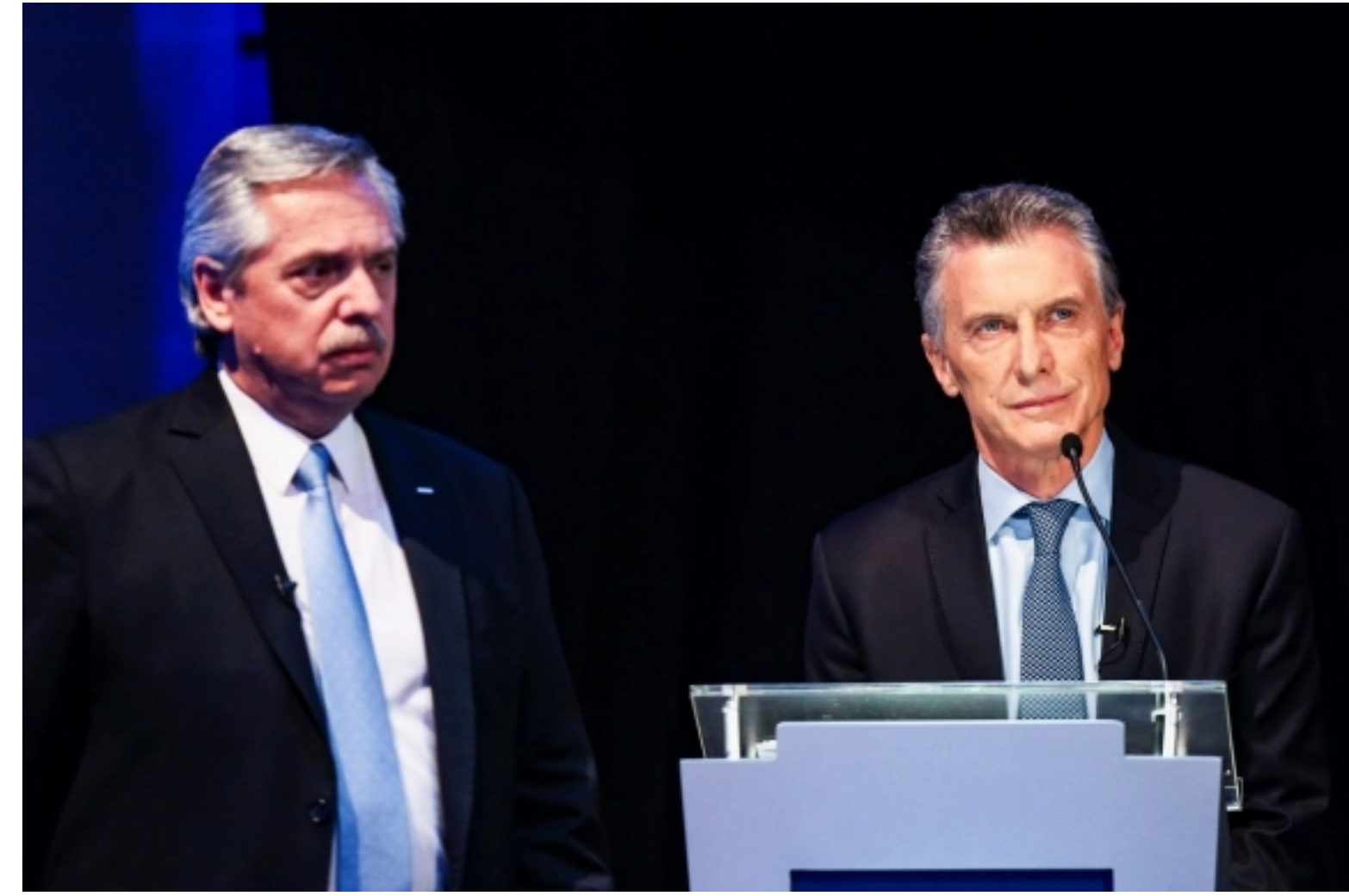
Alberto Fernández y el presidente Mauricio Macri fueron el centro del debate con fuertes críticas y acusaciones.

-Creo que después de las declaraciones iniciales de Alberto Fernández , el tono se ha empezado a moderar. Estamos en campaña en Argentina, lo cual complica mucho más las cosas, pero la lectura que hago es que en caso de ganar Alberto Fernández va a ser mucho más factible que el Parlamento argentino ratifique el acuerdo que si gana Macri. Con Fernández, un Parlamento con mayoría peronista no va a tener demasiadas opciones, me refiero a que la situación económica y política es sumamente complicada. Si no lo firma el riesgo es doble, por un lado un enfrentamiento con la UE y por otro con Brasil y los demás socios, con la posibilidad de ruptura del Mercosur. En momentos donde Argentina va a necesitar negociar la deuda con el FMI, perder el apoyo europeo sería sumamente complejo y por lo tanto en un escenario de presencia del kirchnerismo al frente del gobierno veo factible que se firme. En caso hipotético de que Macri gane, la firma sería prácticamente automática pero la negociación parlamentaria sería más difícil, porque estando en la oposición es más fácil decir que no.