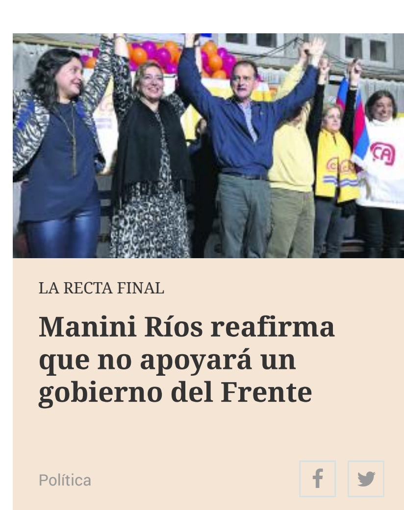
LA RECTA FINAL